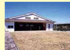
弓道場（6人立ち） 照明施設完備