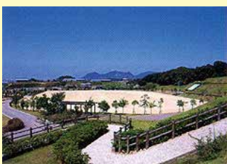
多目的グラウンド ソフトボール・サッカー ラグビー・グラウンドゴルフなど