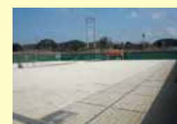
テニスコート（クレー） 3面