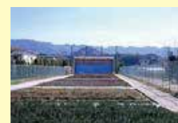
アーチェリー場（4人立ち）