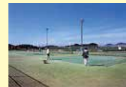
テニスコート（人工芝） 4面 照明施設完備