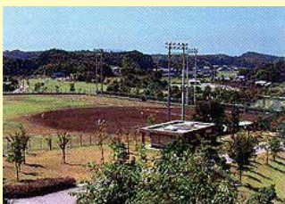
野球場（軟式） 照明施設完備